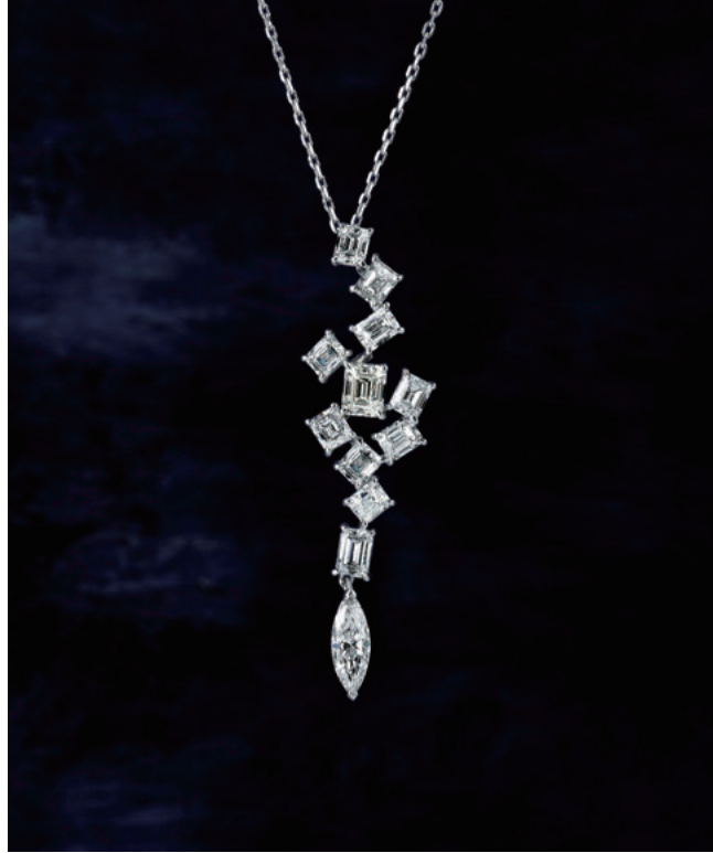
世界一美しいラザールダイヤモンドの中でも特に七色に強く光り輝く石のみを厳選している。一度見たら忘れられない輝きに、メディア取材も絶えない