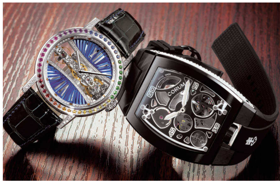
「コルム」「ジラール・ベルゴ」「ガランテ」「クレドール」「エベル」「クエルポ」等、世界に数本しかない限定品をはじめ、時計好きも納得の逸品を数多く揃えている