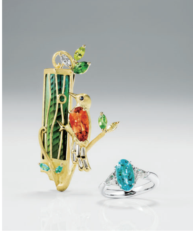
ルースの品質も申し分なく、オリジナルジュエリーのオーダーも可能。美しさはもちろんのこと肌当たりといった細部に至るまで手を抜かず、心から愛せる珠玉のジュエリーを提案してくれる