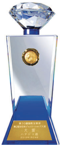
矢野経済研究所が中心となって立ち上げた日本宝飾記者会主催の「全日本ジュエリーショップ大賞」を2019年に受賞し、日本一の宝石店に選ばれた