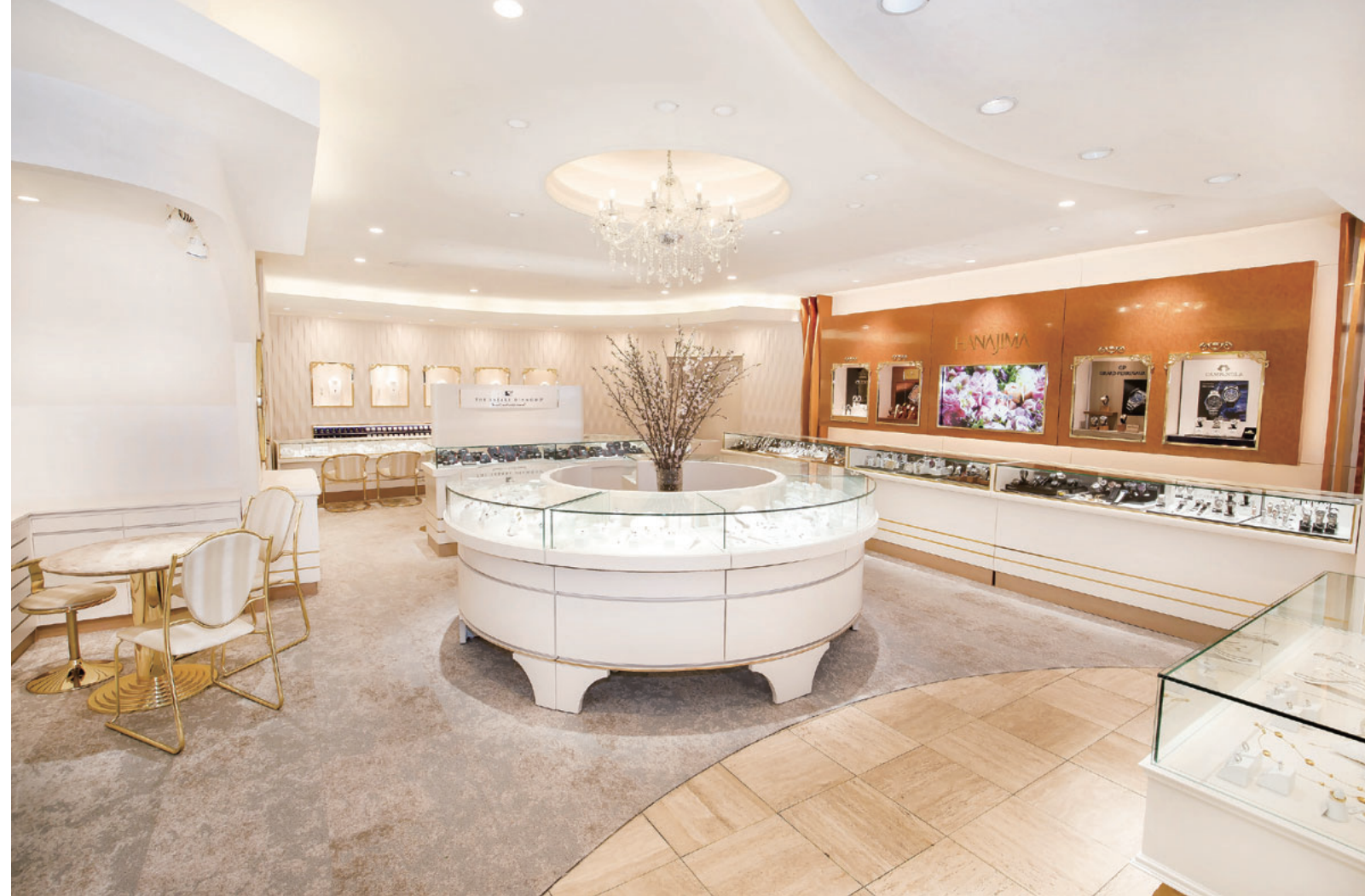
創業60周年を機に、よりラグジュアリーで優雅な店内へとリニューアル。銀座を通り越し全国各地から訪れるファンも多い