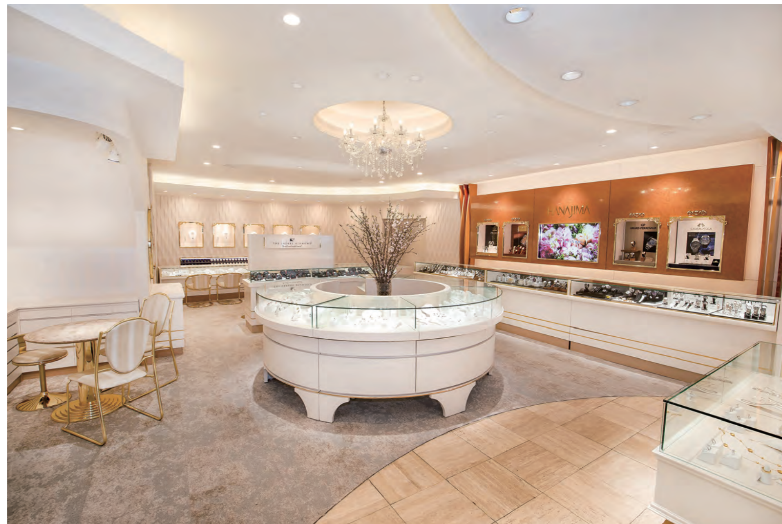
創業60周年を機に、よりラグジュアリーで優雅な店内へとリニューアル。銀座を通り越し全国各地から訪れるファンも多い。