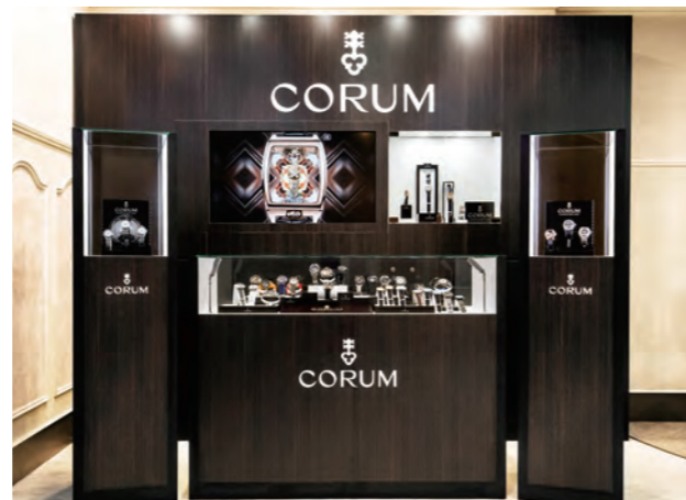
「クレドール」、「ジラルール・ベルゴ」をはじめ、厳選ブランドの時計が揃う2階には日本唯一の「コラムインショップ」もある。