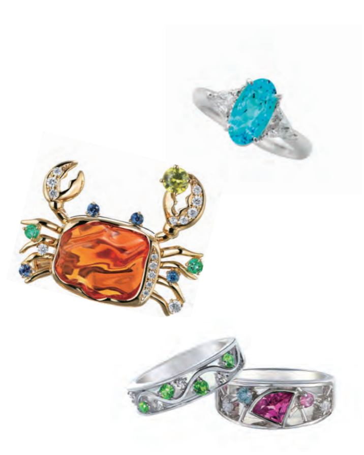
ルースの品質も申し分なく、オリジナルジュエリーのオーダーも可能。美しさはもちろんのこと、肌当たりといった細部に至るまで手を抜かず心から愛せる珠玉のジュエリーを提案してくれる。