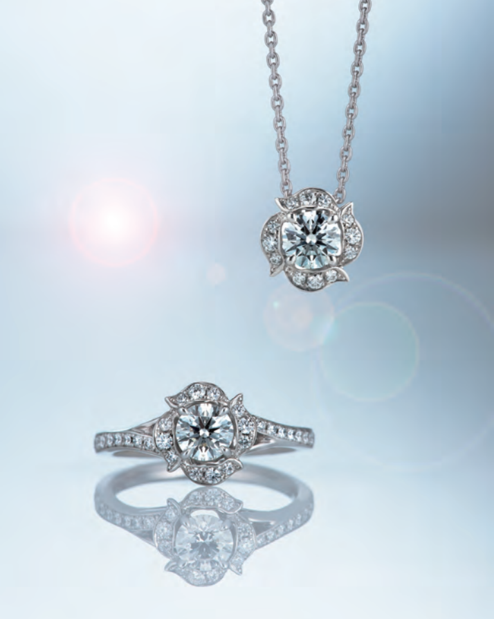
世界一美しいラザールダイヤモンドの中から特に七色に強く光り輝く石のみを厳選している。一度見たら忘れられない輝きに、メディア取材も絶える事がない。